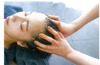
ひんやり爽快ヘッドケア