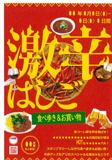
イベントのイメージ