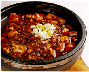
汗だく必死の麻婆豆腐