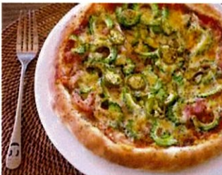
ゴーヤベーコン激辛ピザ