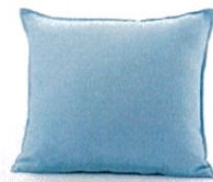
ひんやりクッション