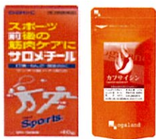
カプサイシンのサプリ&軟膏