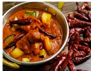
旨辛ベジタブルチキンカレー