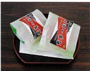
ロシアンルーレット饅頭